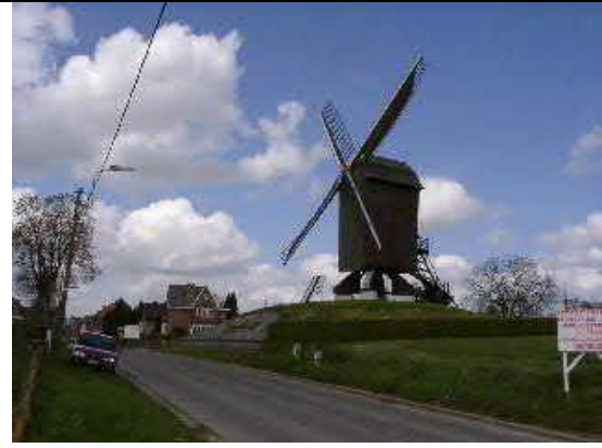
Te Rullegem, een houten staakmolen

Rij verder na het bezoek in de Hoogstraat, neem links de Groenlaan, vervolg rechts via Markt, en ga rechts in de Peperstraat, (zie wegwijzers) en neem onmiddellijk terug rechts de Molenstraat. Aan de linkerkant staat de Molen Ter Rullegem. (6)