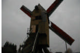
Op het einde rechts staat de Wildermolen. (7)

Vervolg in de Molenstraat, richting Woubrechtgem/Aspelare, via Sint-Antelinksstraat, rechtdoor in Huigeveldstraat richting centrum St. Antelinks. Bij de kerk linksaf via de Langestraat en Cyriel Prielstraat naar de N460 in Aspelare. Neem hier de N460, Geeraardsbergsesteenweg rechts, en kruis de N8. Rij verder en ga in Voorde linksaf, de Lepelstraat in. Dit wordt Cambergstraat, vervolgens Zevenhoek. Kruis de N45, en neem rechtdoor de Johannes-Baptist Van Langenhaeckestraat tot het dorp van Appelterre. Neem schuin rechtsaf, de Tangereelstraat, en vervolgens links de Wilderstraat.