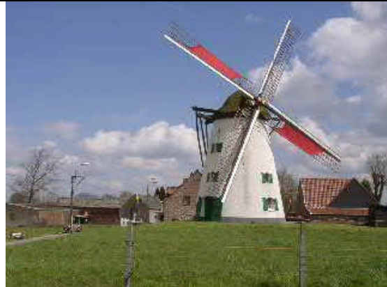
Ter Rijst een stenen grondzeiler.

Neem de N9, en rij opnieuw rechts richting Gent, tot de eerstvolgende verkeerslichten. Neem links de N42 richting Zottegem/Oosterzele. Rij over de zwevende rotonde boven de E40, en blijf de N42 volgen. In Oombergen kruis je de N46, en vervolgens bij de tweede verkeerslichten neem je links richting Herzele. Dit is de Leenstraat. Rechts van deze weg in de Stenenmolenstraat kun je nog de romp van de Stenen Molen van Grotenberge zien. Verderop wordt de Leenstraat Hoogstraat, en rechts tref je de stenen grondzeiler. De windmolen Ter Rijst. (5)